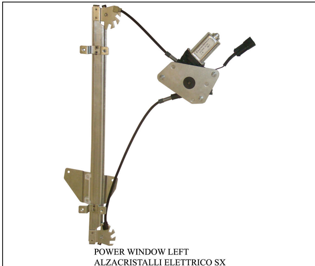
POWER WINDOW LEFT ALZACRISTALLI ELETTRICO SX

left door - portière gauche - linke tür - puerta lado izquierdo - porta esquerda - porta lato sinistro